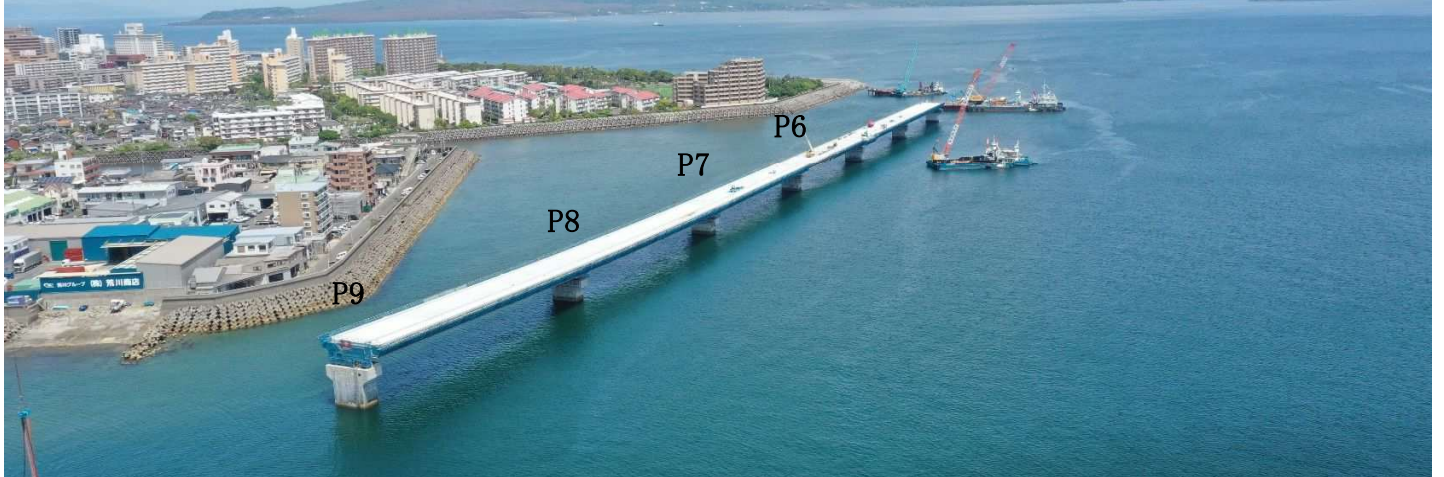
航空写真(P9側から撮影)