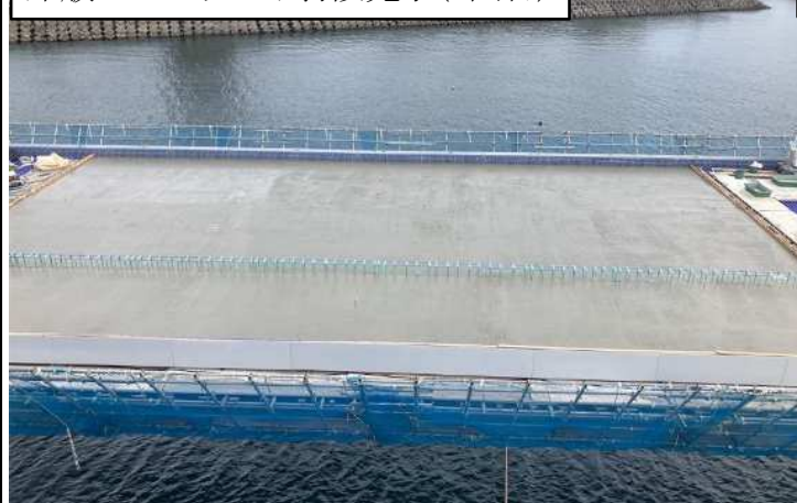
床版コンクリート打設完了(3回目)