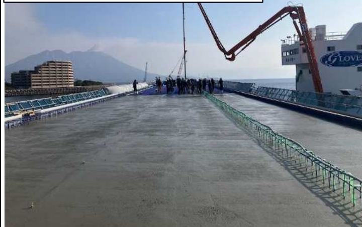
床版コンクリート打設状況(海上から撮影)