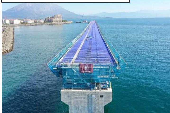
床版鉄筋組立完了（P3側から撮影）