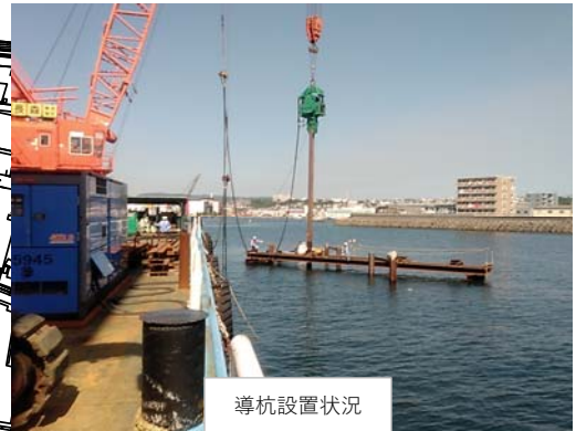
導杭設置状況 (過去工事)

橋脚位置に「導杭・導枠」を設置します。導枠は、のちに設置する鋼管矢板を海底地盤に鉛直に打ち込むための定規の役割を果たします。