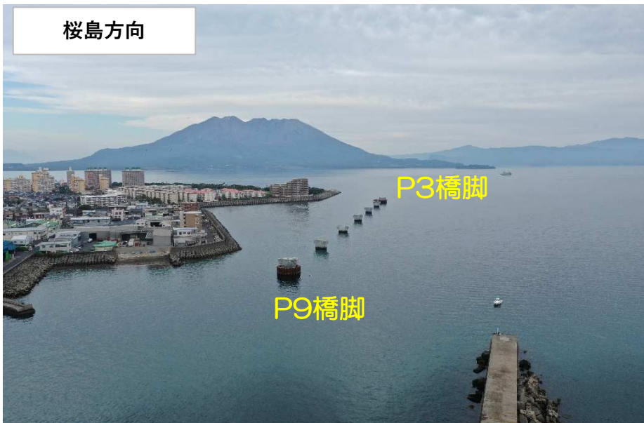
鋼管矢板切断・撤去状況