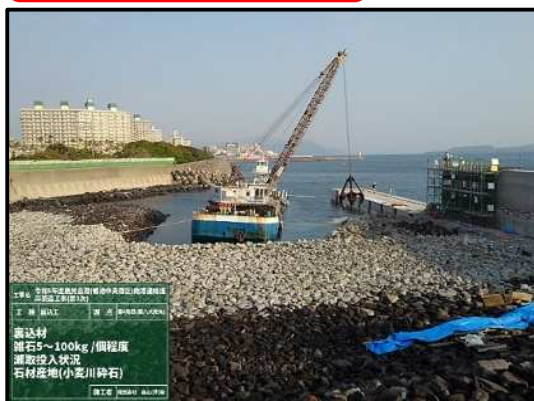
裏込材 雑石5~100kg/個程度 漸次投入状況 石積成地(小笠川砕石)