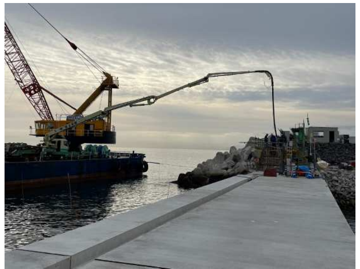
上部工② コンクリート打設