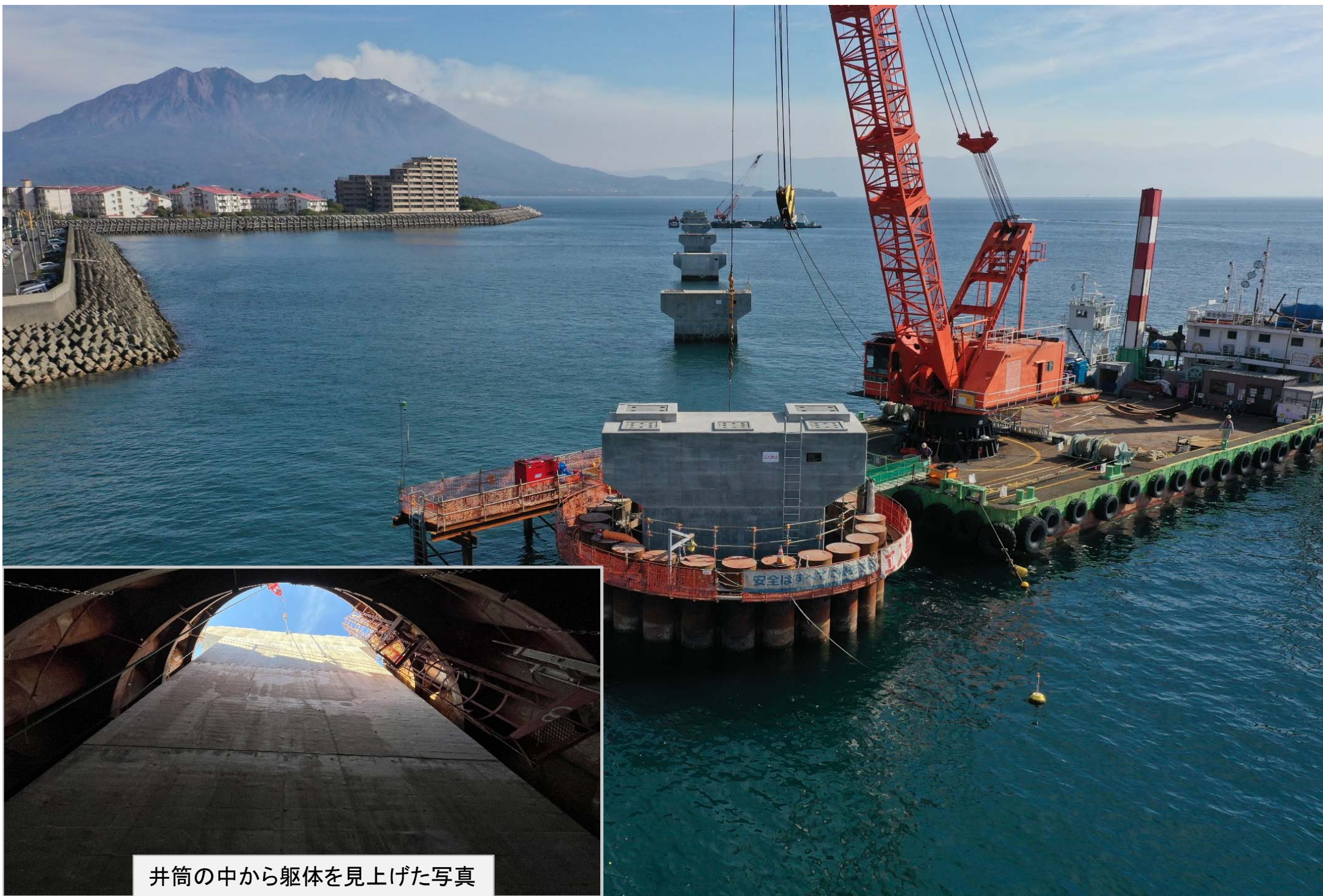
井筒の中から躯体を見上げた写真