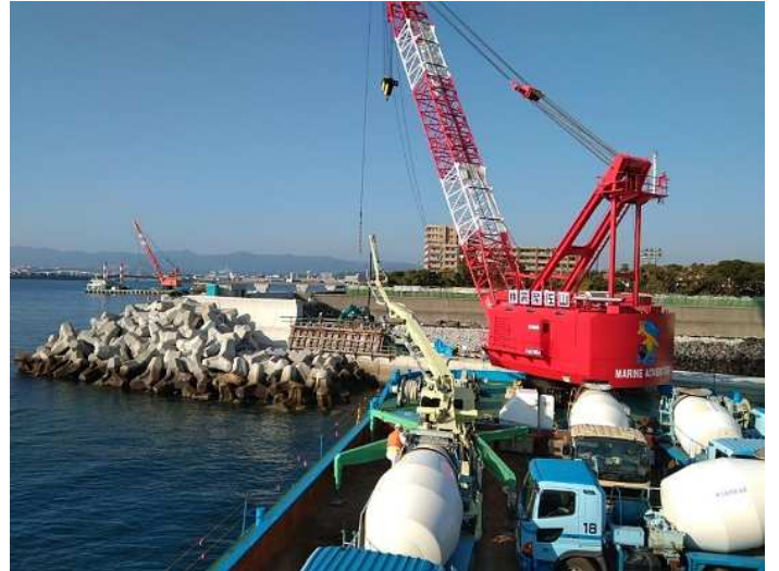
上部工② コンクリート打設