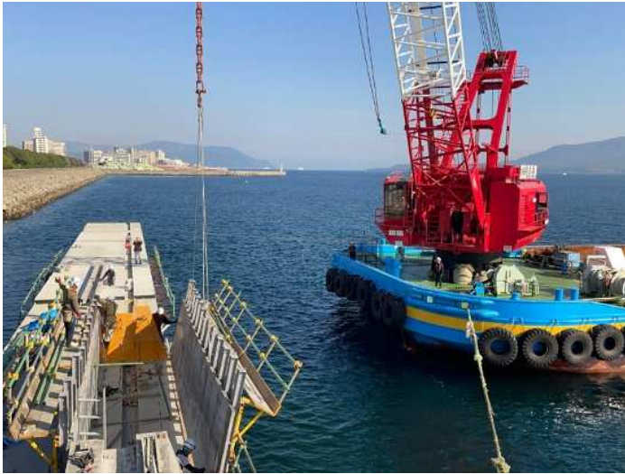
上部工② コンクリート型枠建込