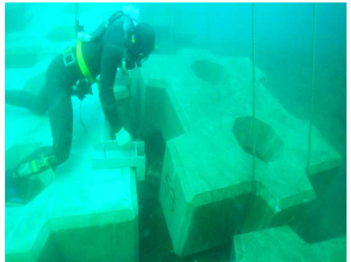
被覆工 被覆ブロック据付