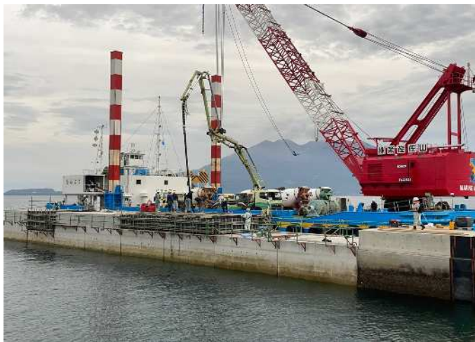
上部工① コンクリート打設