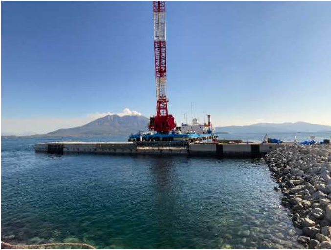
上部工① コンクリート型枠建込