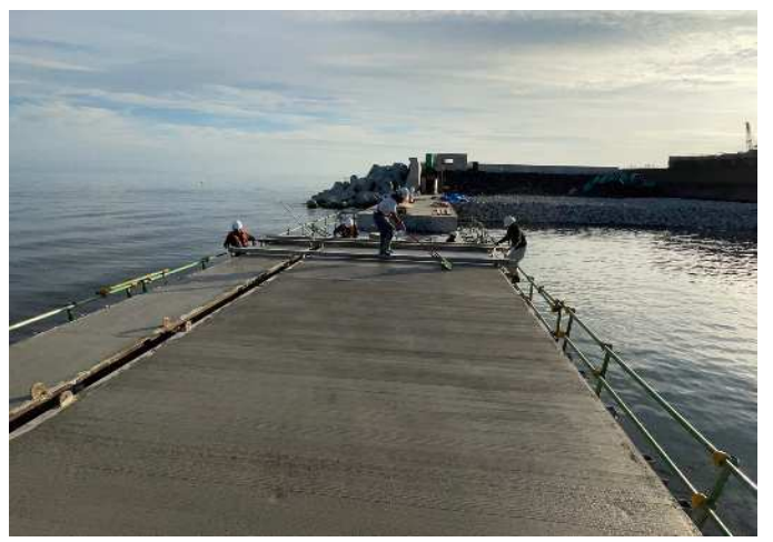
上部工① コンクリート仕上げ