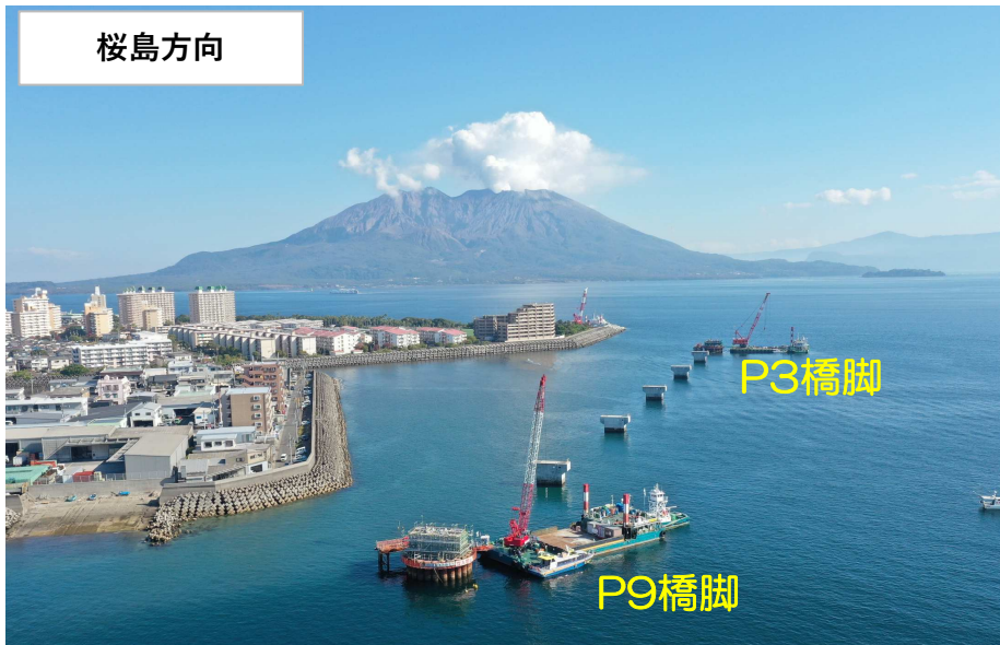
梁鉄筋・型枠組立完了