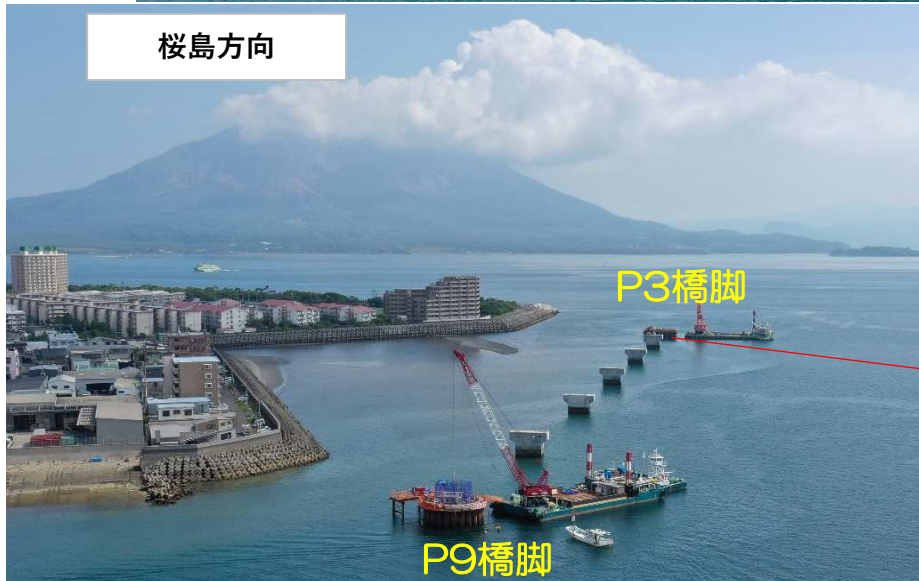
柱鉄筋組立状況 (令和5年9月27日撮影)