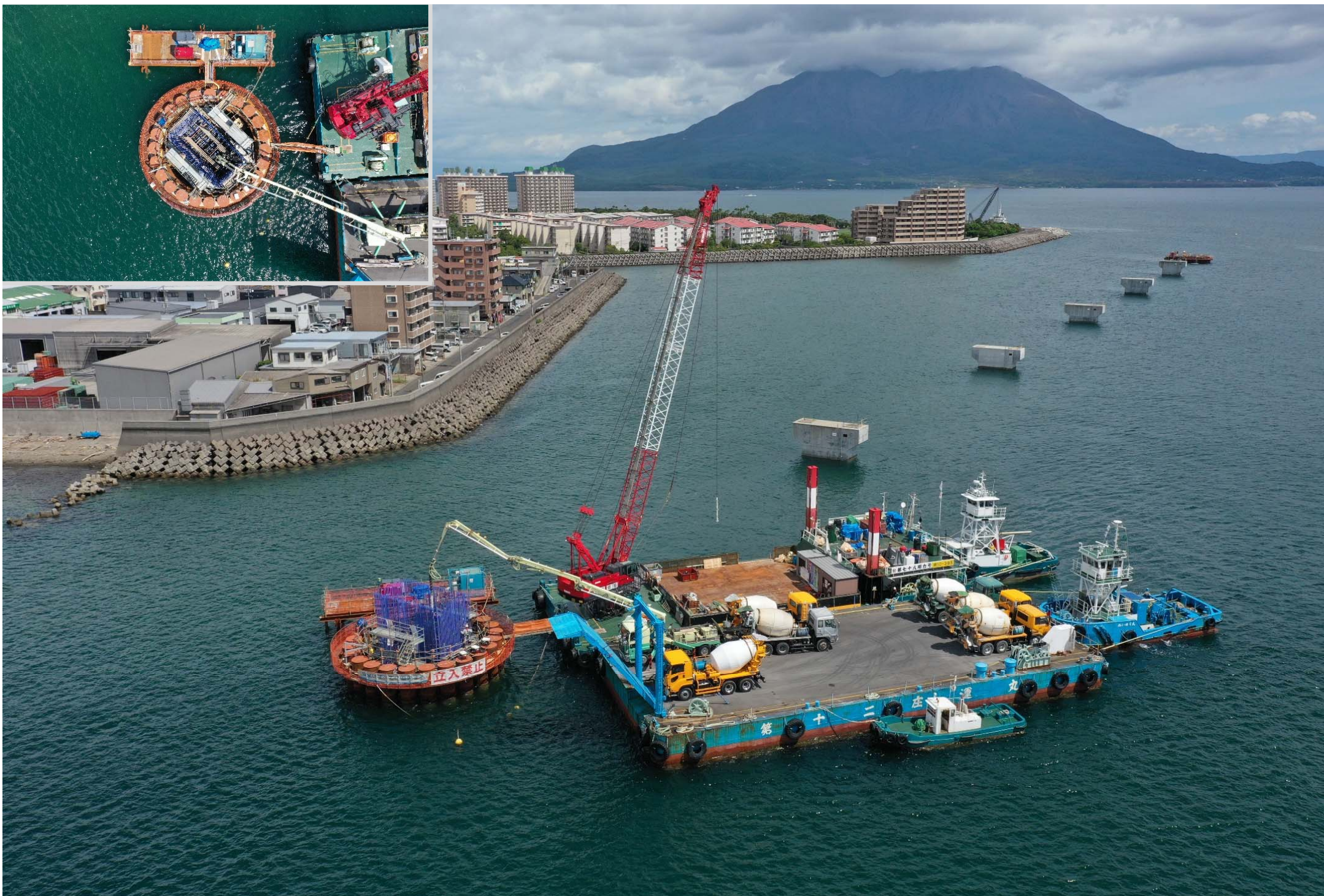
(令和5年 9月21日 撮影：躯体コンクリート(2Lot)打設状況)