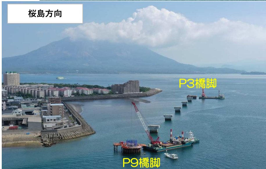
柱コンクリート打設状況 (令和5年10月13日撮影)