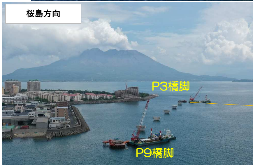
柱コンクリート打設状況 (令和5年9月13日撮影)