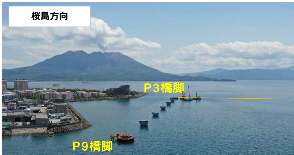
ドライアップ状況(6月9日撮影)