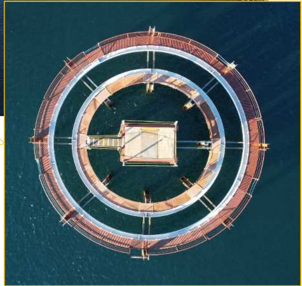
(令和4年12月15日撮影 五洋建設(株))