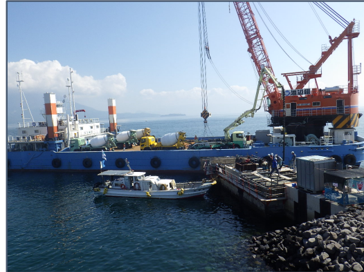
コンクリート打設

アジテータ車(生コン運搬車)とコンクリートポンプ車を起重機船に積み込み、海上運搬します。現地で護岸本体の上に更にコンクリートを打設します。